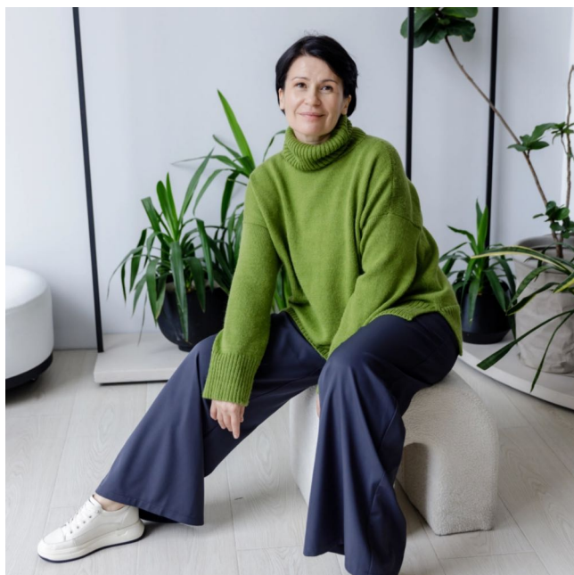
Описание вязания #Монохром_POP UP

Вот лишь малая часть того, что может вам понравиться: