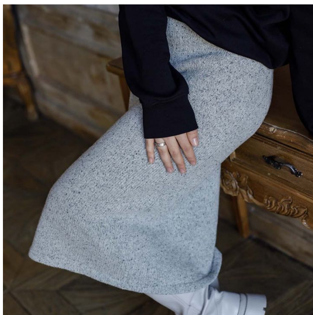
Описание вязания #Юбка_карандаш