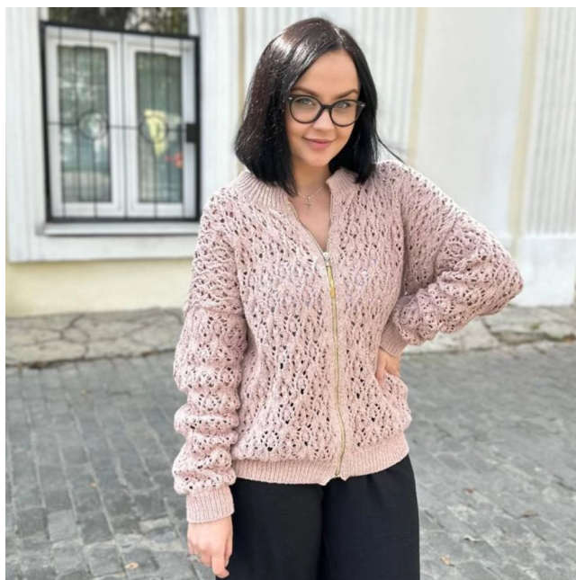
Описание вязания #Упругий_карди