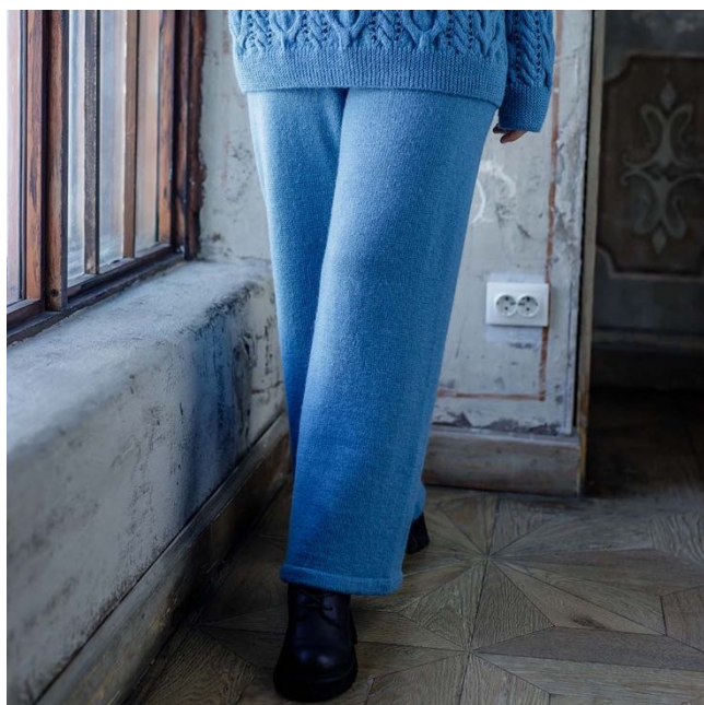
Описание вязания #Брюки_Палаццо