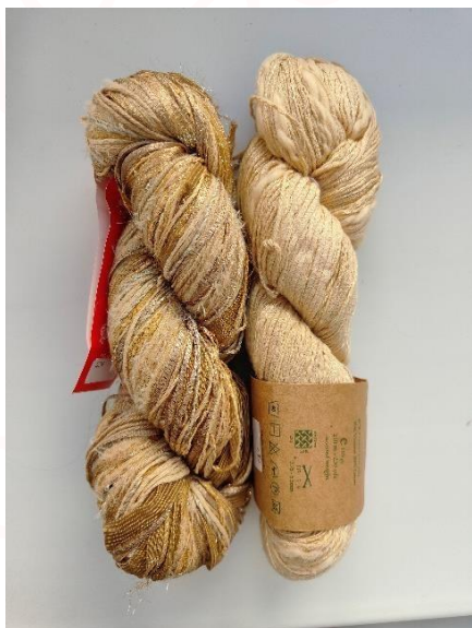
Фото 3: пасма alp natural цвет 717 и alp dazzle 524

После того, как я разобрала пасму alp natural, у меня получилось 5 фактур (фото 4). Еще раз напоминаю, что все пасмы ручной работы могут немного отличаться по фактурам, но примерно у вас будет также.