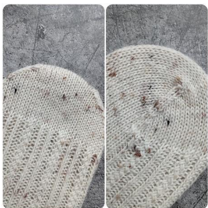
Схема убавок 3-2-1-1-1 . Цифры означают, сколько лицевых рядов нужно провязать между убавками.

Мысок начинаем вязать примерно с середины мизинца, носок должен быть не довязан на 4-6 см.