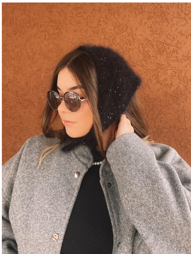
Рабома @ Lavery.accessories