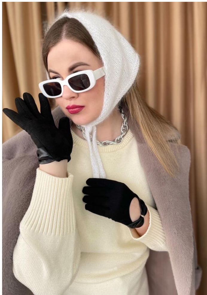
Рабома @ evmarakova