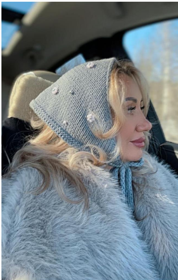
Рабома @ Botescu_alena