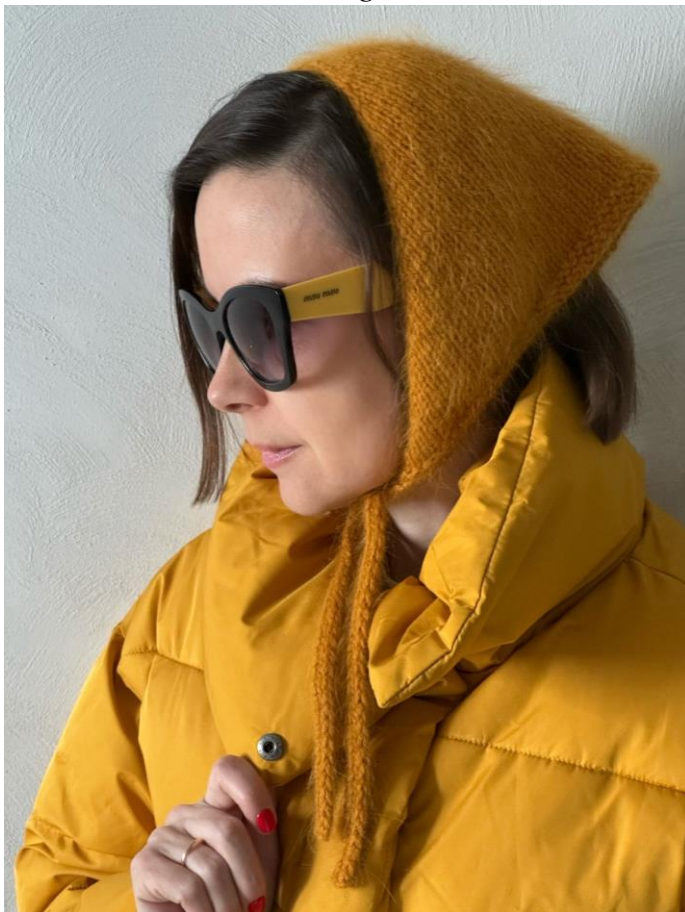
Рабома @ iris_knitting2021