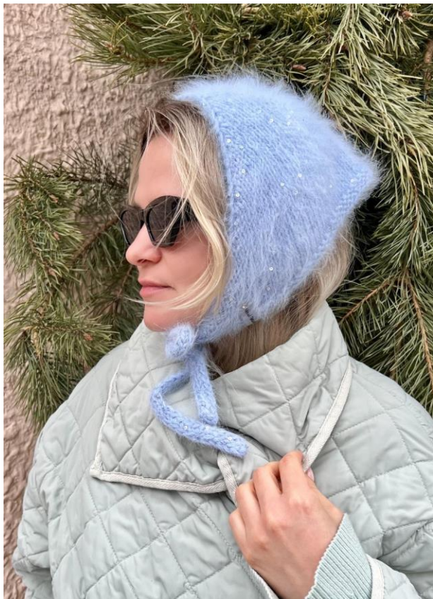
Рабома @ elena_semen