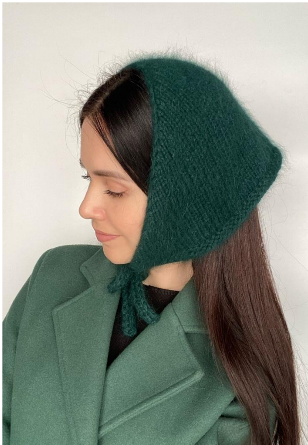
Рабома @ Julii_withlove