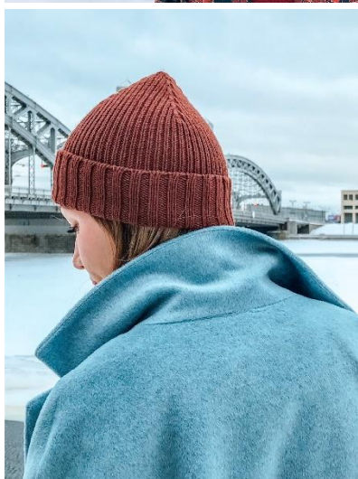
«4 клина», с одним отворотом