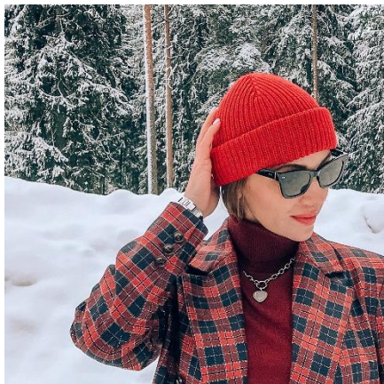
- «Монатик», с двумя отворотами

(модель шапки «Монатик» с двумя отворотами и модель шапки с одним отворотом)