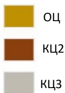
СХЕМА ЖАККАРДА для размеров 2 и 4