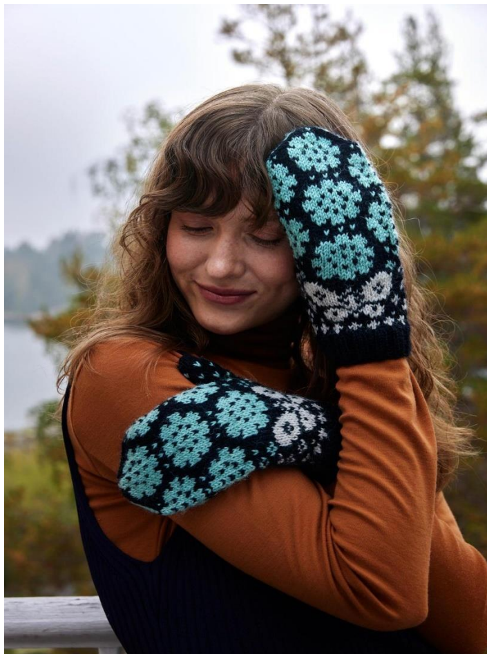
УЗОР ДЛЯ ВЯЗАНИЯ