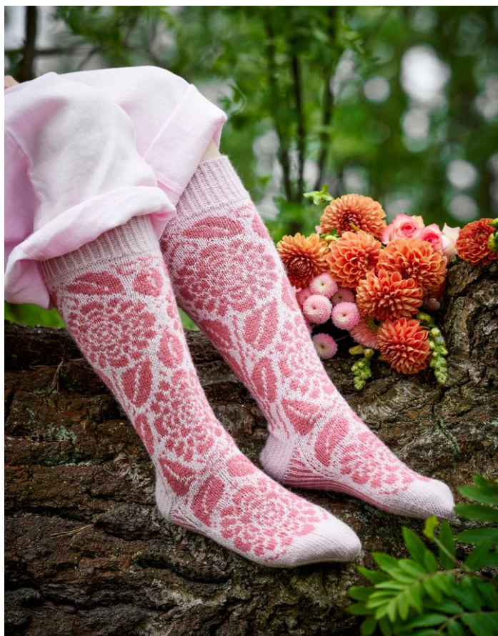
Носки как летний букет