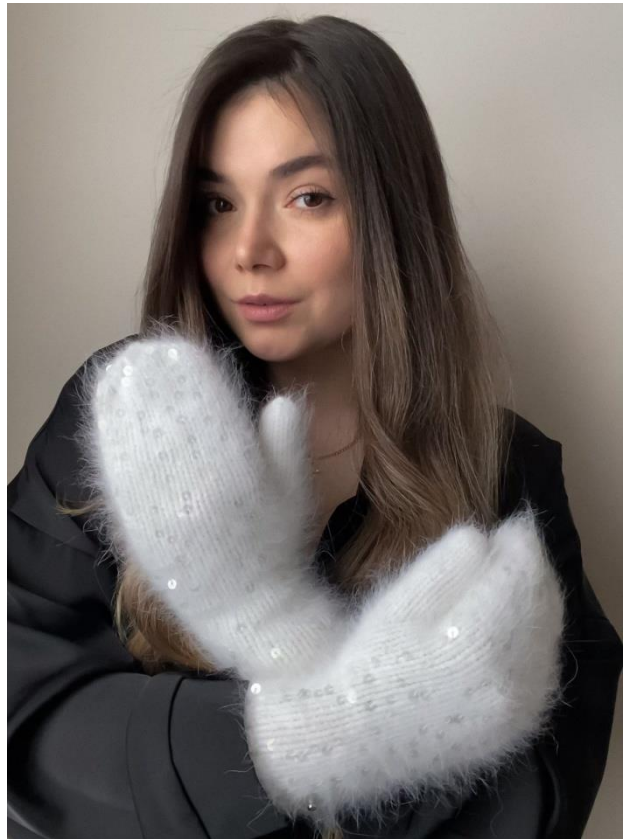
Pa6oma @ Lavery.accessories