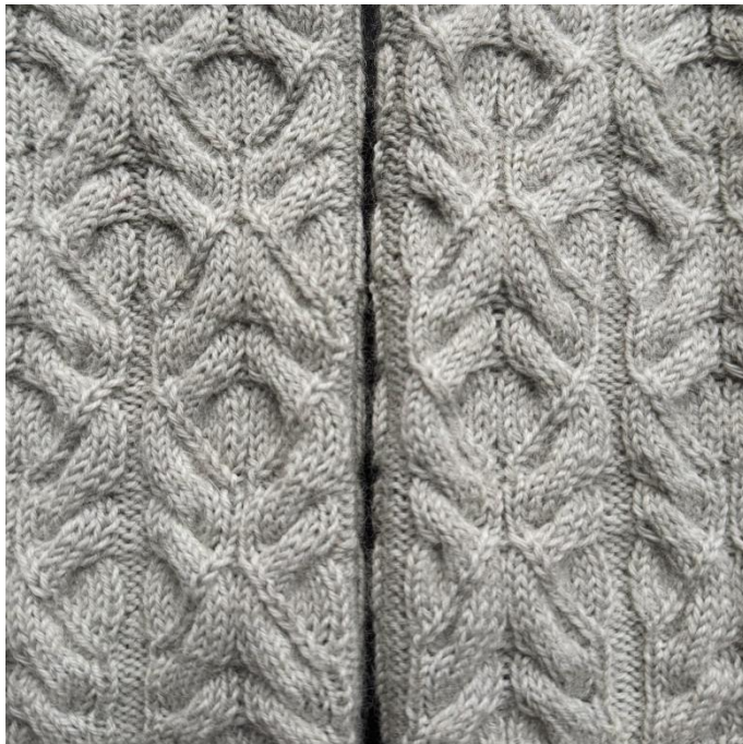
Фото узора в полотне