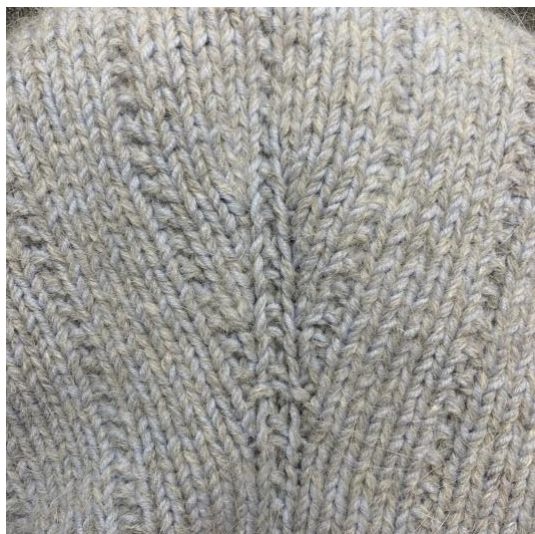
Фото узора затылочной части, далее пошаговое описание.

2 ряд: накид, 35/39 петель по узору, ПП, 1 петля изнаночная, ПЛ, 34/38 петель по узору, развернуть вязание.