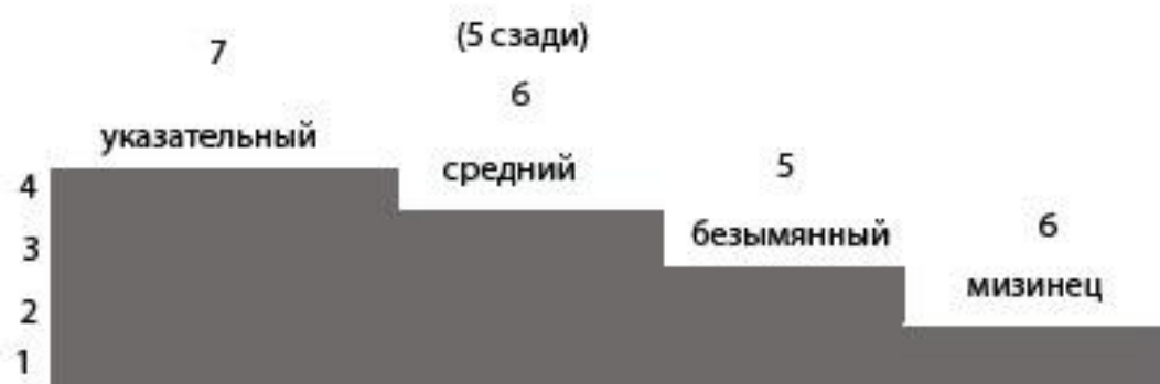
Схема прибавок петель из протяжек для вывязывания пальцев:

Схема распределения петель для вывязывания пальцев: