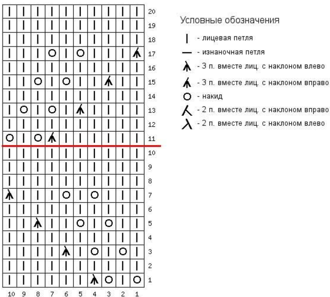
Схема 3.1 Узор Листья для вязания круговыми рядами

Часть 2 вяжем лицевой гладью. Путем примерки определяем высоту начала формирования клина для пальца. Распределяем петли ладонной стороны перед началом формирования клина так: 12 лиц, М, 1 лиц (ЦПК) , М, 2/3 лиц. Начиная со следующего ряда формируем клин для пальца по алгоритму, приведенному выше.