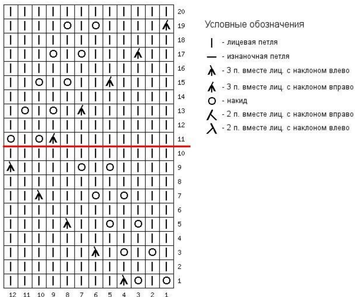
Схема 1 Узора Листья для вязания круговыми рядами

1 ряд: МНР, (н, 1 лиц, н, 2 вместе с наклоном влево, 8 лиц) – повторяем до конца ряда.