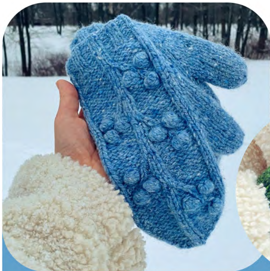
схема для вязания