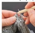
2пЛ – 2 перекрещенные петли влево

Меняем ориентацию лицевой петли так, чтобы ее левая стенка (долька, ножка) оказалась впереди.