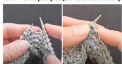
2пП – 2 перекрещенные петли вправо

Меняем ориентацию лицевой петли так, чтобы ее правая стенка оказалась впереди. Возвращаем 2 петли на левую спицу. Провязываем эти 2 петли вместе лицевой.