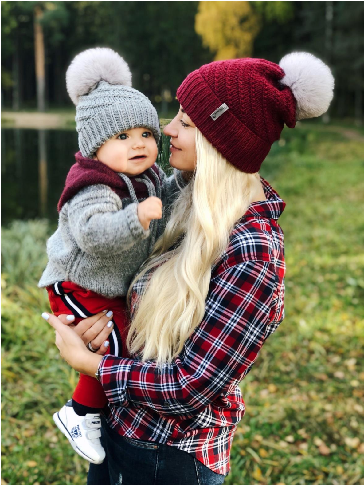
Pattern «Alpine hat»