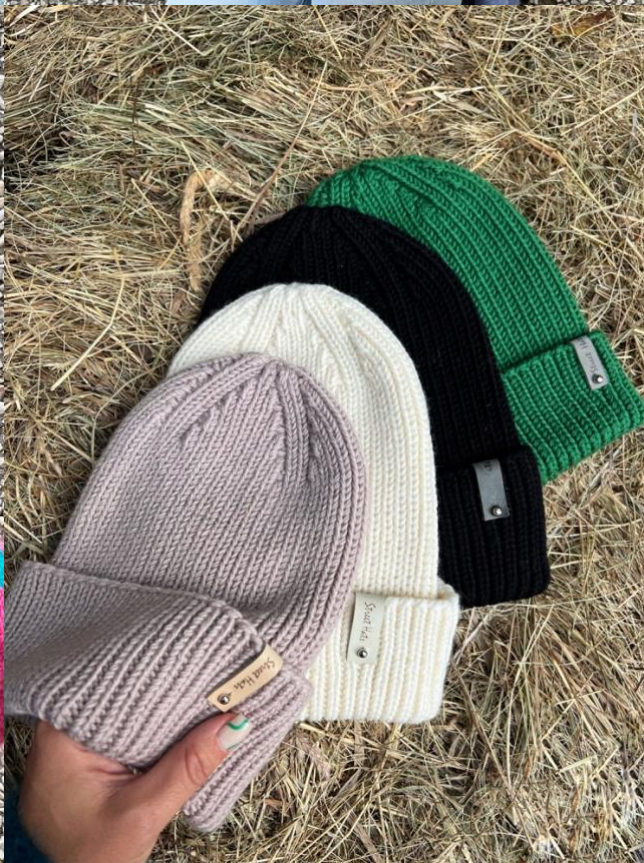
Описание Шапка «FIRE»

Автор: Наталья Жданова street.hats.repeat