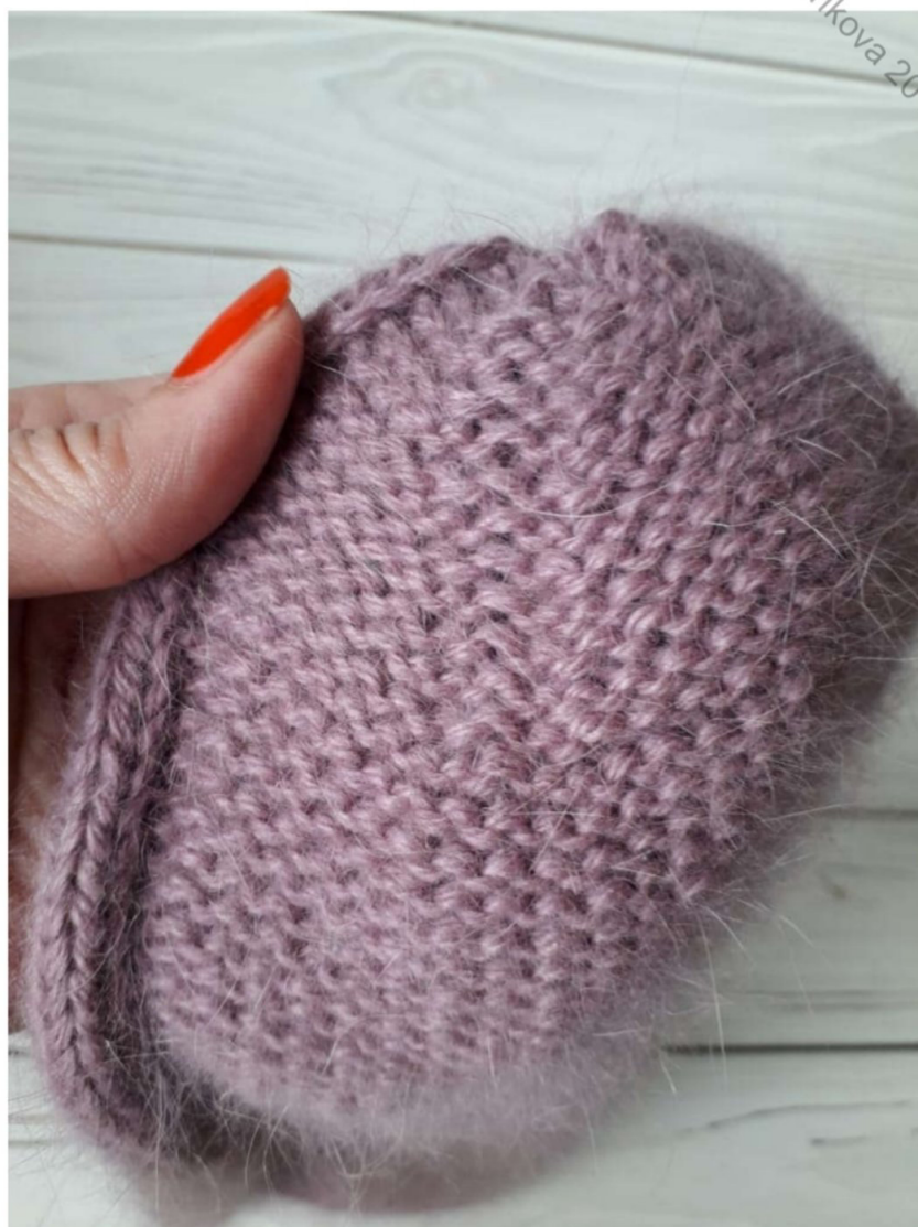
Вид убавок на изнаночной глади: