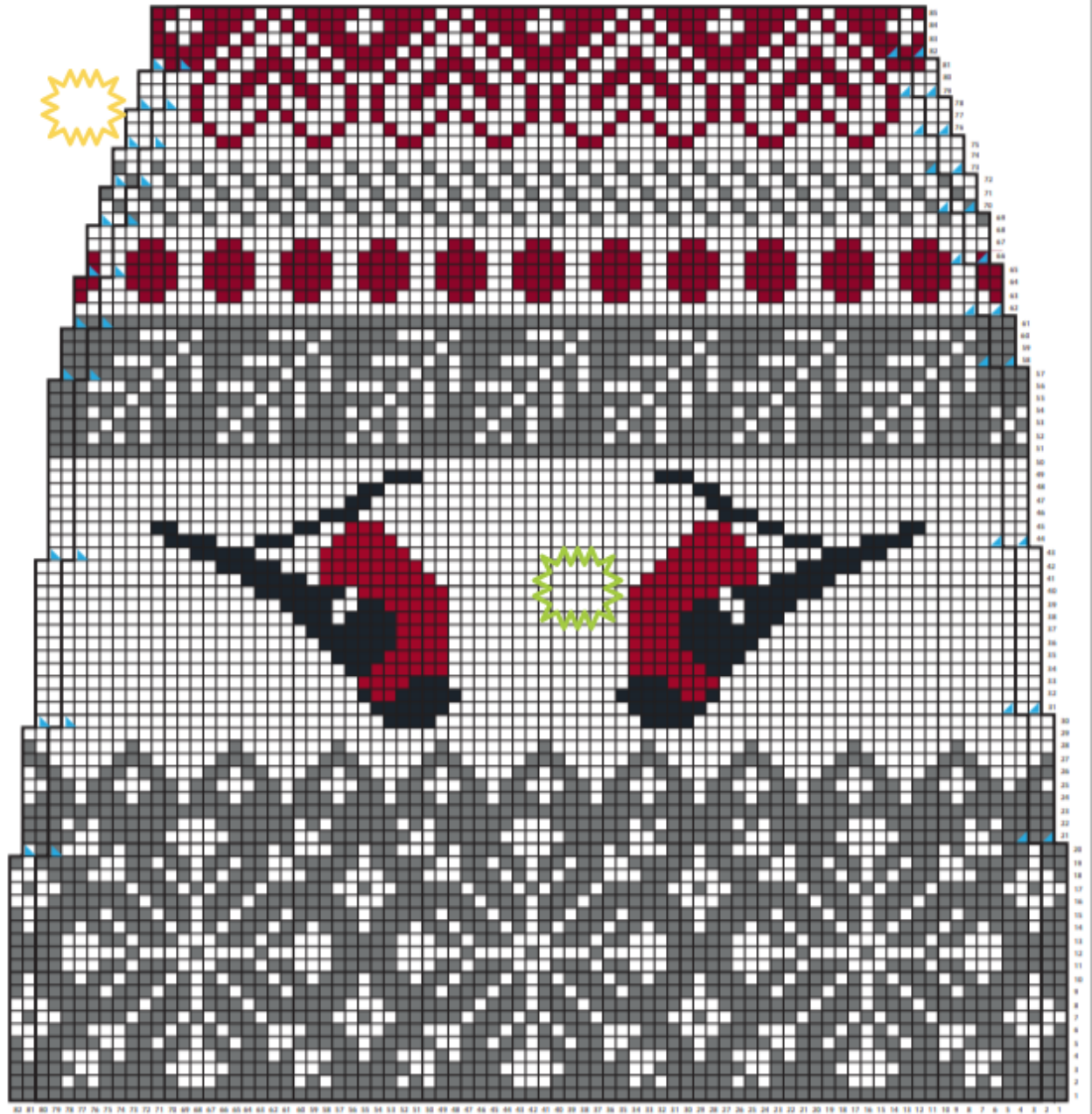
KOKO 38 B-KAAVIO