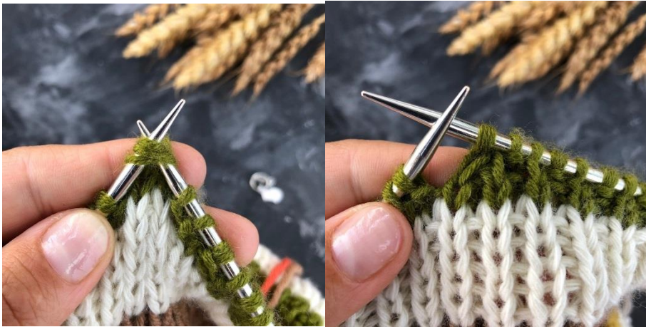
Видео Убавка 3 петли вместе изнаночной