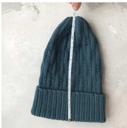
Фото 1. Как делать правильно замер высоты шапки с отворотом