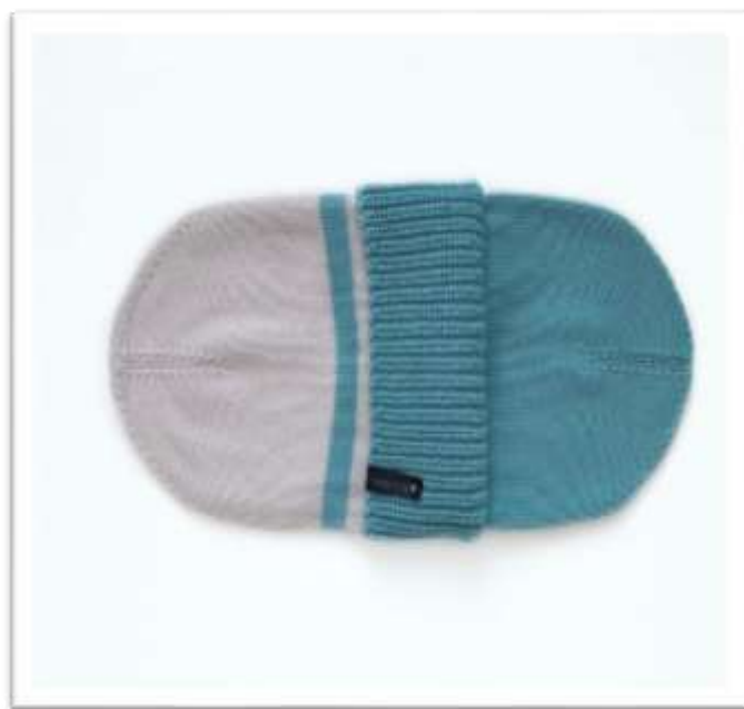
Таблица №5 Удлиненная макушка