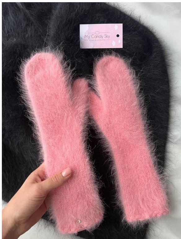
Варежки средней длины