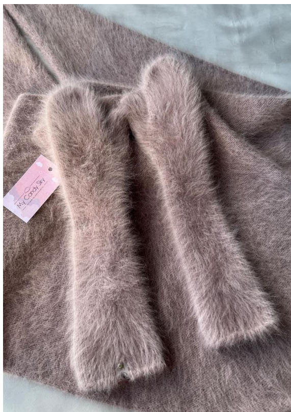
Варежки длинные до локтя