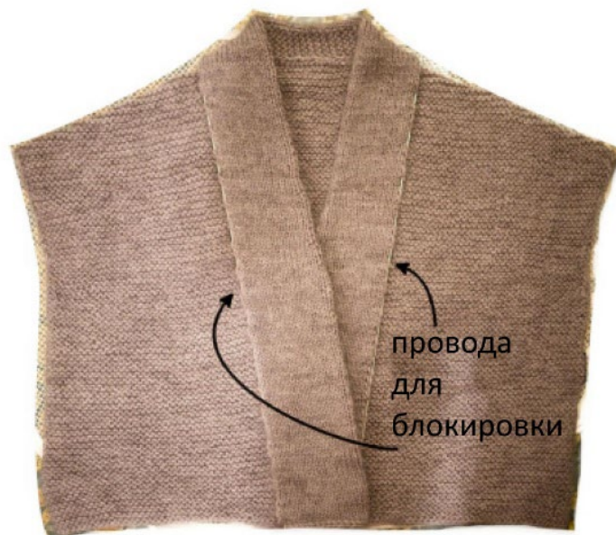
Рисунок 3: Опционально, Вы можете использовать провода для блокировки, чтобы контролировать скручивание края.

Если у Вас есть провода для блокировки, то Вы можете вставить их вдоль внешнего края воротника как показано на Рис. 3.