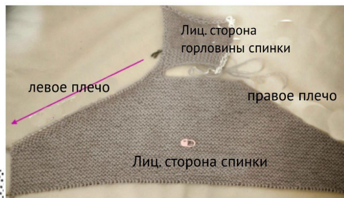
Рисунок 1: Соединить горловину спинки с левой полочкой (Ряды 1-4 уже провязаны)

Продолжить вязать пряжей от горловины спинки, лиц. стороной спинки к себе (Рис. 1), поднять и провязать лиц.п. 51 (56, 61, 65, 70) {73, 73, 75, 78, 79} п. (см. примечание ниже) вдоль левого наклонного края спинки от края горловины до съёмного маркера (теперь его можно удалить).