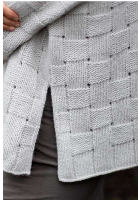
BELFAIR PULLOVER от HIROMI NAGASAWA