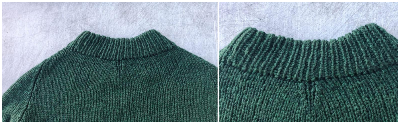
Вытачка на спине (центральные убавления).

М1 - 53 пет. спинка - М4 - 47 пет. перед.