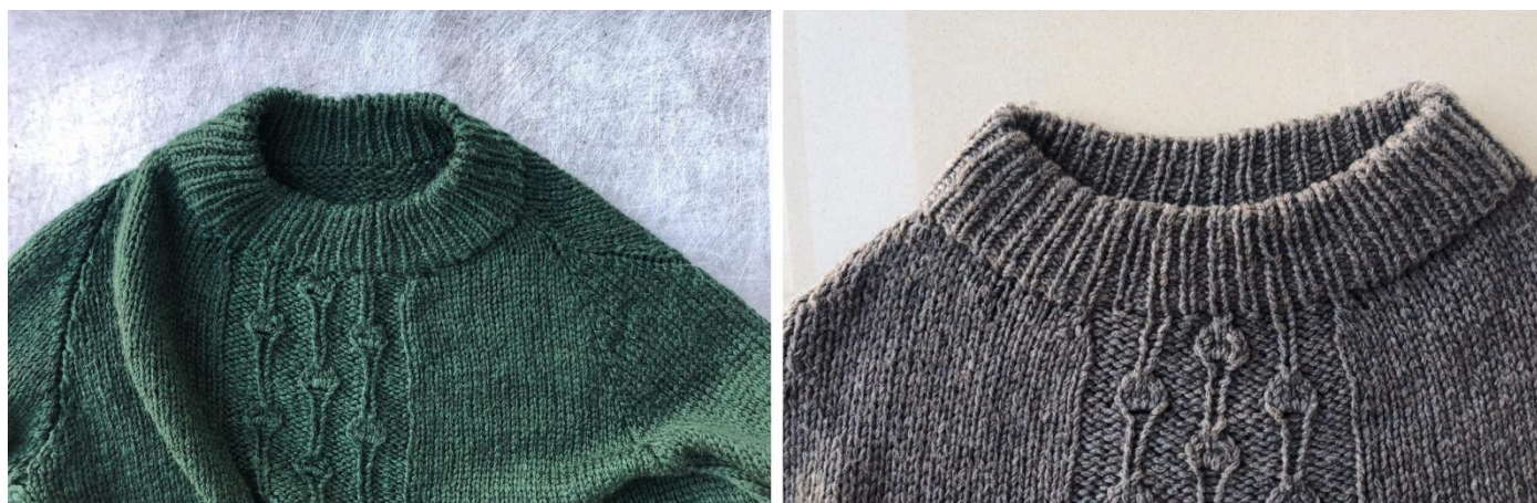
Центральные убавления на перед.