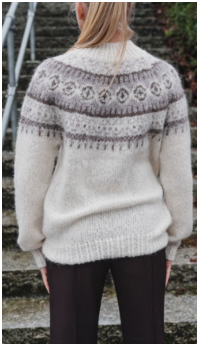
Свитер вяжется сверху вниз

Проверьте плотность вязания, связав образец. Посчитайте количество петель на 10 см, если у вас петель больше, чем указано, смените спицы на более толстые, если петель меньше, смените спицы на более тонкие.