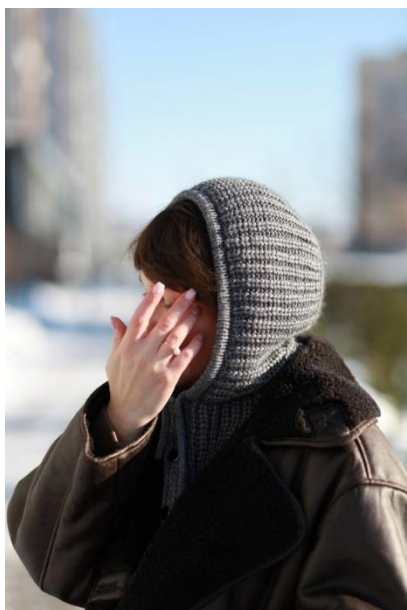
капор из кашемира Аурум с грудкой для V выреза

Посадка видео https://youtu.be/7Hoy1LGARyY