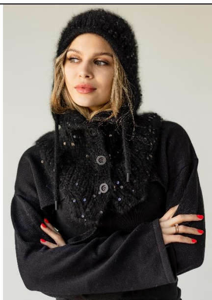
Капор из норки с пайетками с грудкой