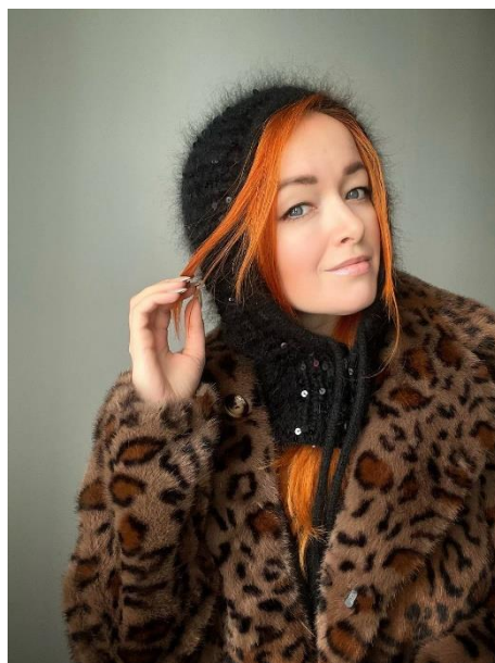
капор из норки с пайетками анатомический ворот