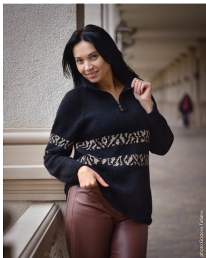
@tatianagosteva6000(Разм XL) Бобинная Lanificio dell Olivio Dulcos2 в 2 нити 37% бэби альпака 18% мерино 45% полиамид 100г650м Расход 340гр