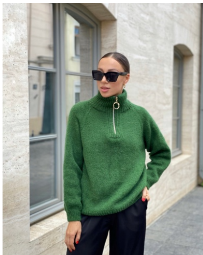
@y.dema_accessories (Разм L) Бобинный мохер 100г/500м в 2 нити Расход 430гр