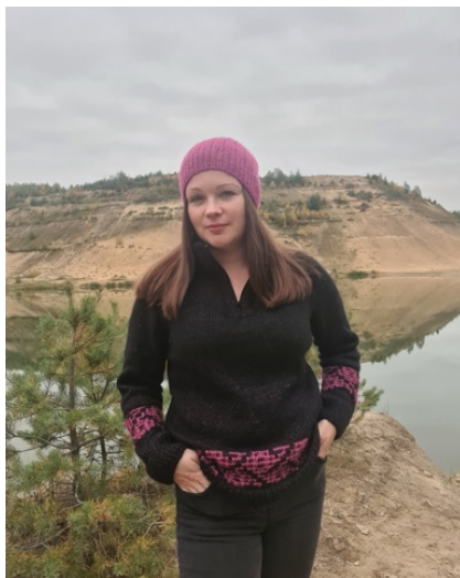
@iraiv3 (Разм М) Бобинная Pinori filati Spa Сарруссино 100г/220м 40% хлопок 36% шерсть 25% полиамид Расход осн.цвета 460гр Фуксия на жаккард 40гр