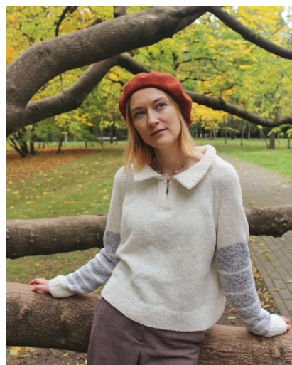
@iris.withkiss (Разм S) 1 нить - бобин. 100г/375м ангора/меринос/па 2 нить - Butterfly хлопок/па Полосы - хлопок + меринос/ кашемир/лен/вискоза Расход 300гр