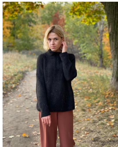
@keko_knit (Разм S) Infinity Design Tweed 5 мотков