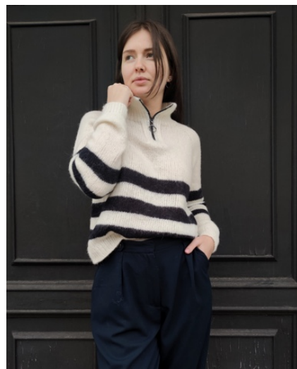
@savimade (Разм М) Бобинная Brioche Pecci Filati 100г/400м в 1 нить 30% альпака 30% меринос 40% па Расход молочной 200гр, черной 50гр