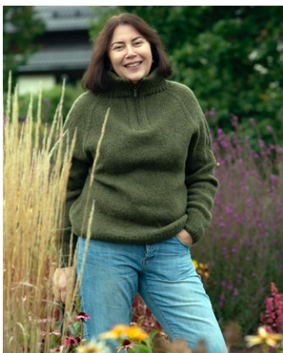
@ilaptiy (Разм XL) Твидовая дундага 6/2 Расход 475гр