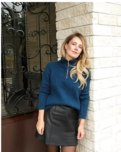
@victoriya_iss (Разм М) Infinity Air Расход 7 мотков