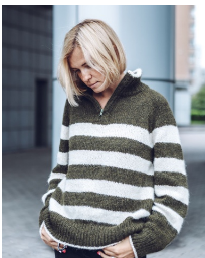
@adiko_knitting (Разм L) Основная - LineaPiu Ghost 100г/520м в 1 нить Расход 290гр Полоски - Yarna Alpaca Cloud 50г/130м в 1 нить Расход 110гр