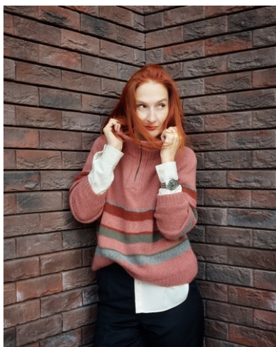
@tanagreenfox (Разм М) Foxy Zegna Baruffa 100г/1500м в 4 нити(100/375м) 75% меринос 25% ангора Расход 260гр (из них по 30гр на полоски каждого цвета)