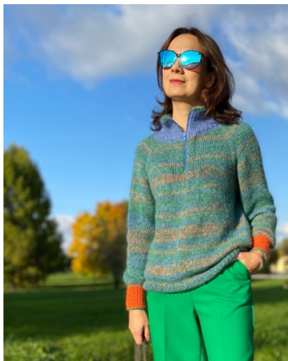
@verazhegalina (Разм XS) Микс моточной и бобинной 1. Lace merino print Lana Grossa 50г/400м, расход 100гр 2. Мохер зеленый Camelot 50г/500м, расход 1,5 мотка 3. Люрекс бобин. 100гр/460м расход 175гр 4. Мохер голубой 100г/2200м в 2 нити, расход 75гр На манжеты меринос/мохер На воротник меринос/мохер