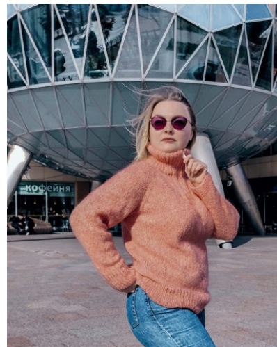
@ustinova_tv_knit (Разм L) Linea Piu Soffio 100г/300м 38% мохер 15% меринос 19% п/а 28 р/с Расход 400гр