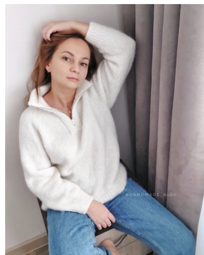
@handmade_alsu (Разм S) Пехорка Новая альпака Расход 6 мотков