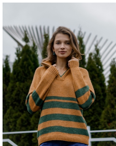
@natalinikolk (Разм M) YarnArt Silky Royal 50г/140м 65% меринос 35% шелковая вискоза Расход 5 мотков (горчица) 2 мотка (зеленый)