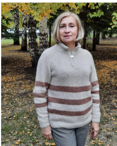
@i.mikhailova7324 (Разм M) Drops Air 50г/150м Расход 320гр (6 мотков+20гр) Основной цвет 266гр Полоски 54гр