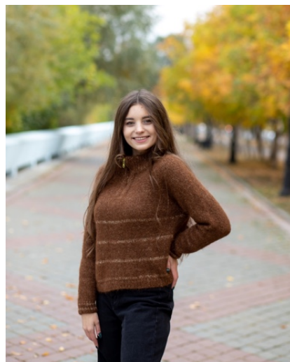
@ms_knit (Разм M) Nobil от Luxury Selection By Ri. Go в 1 нить Расход 350гр (из них 20 гр на полоски)