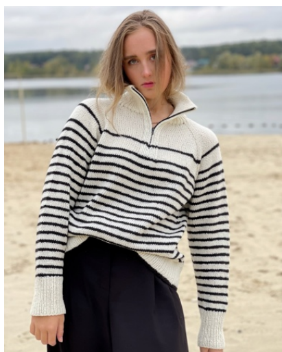
@ekaterinasvev (Разм M) Бобинная Tempino альпака/меринос/па 100г/270м Расход 310гр (молочного) 145гр (черного)