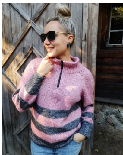
@lynn.smirnova (Разм M) Katia Cotton-Merino 50г/110м Расход 7 мотков (розовый) 3 мотка (черный)