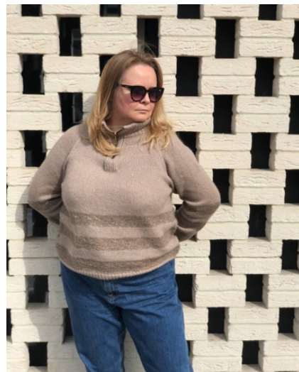
@sana.knitwear (Разм XXL) Fluffy 100г/380м 78% пух мериноса 22% п/а Расход 342гр (из них 104гр на полосы)