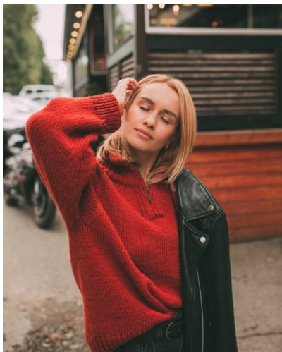
@trendy_knitter (Разм М) Alize Lanagold classic 100г/240м Расход 4,5 мотка