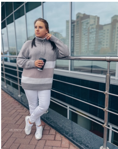
@dk_knitstyle (Разм XL) 100% кашемир Brunello Cucinelli 100/600м в 2 нити Расход серый 260гр, белый 60гр, розовый 50гр