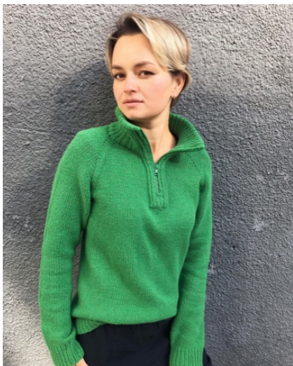
@olgaz.knits (Разм XS) Бобинная Zegna Baruffa 1.Cotton 100% 100г/1020м 2 в нити, расход 230гр 2.Opera Washed 100г/533м В 1 нить, расход 230гр