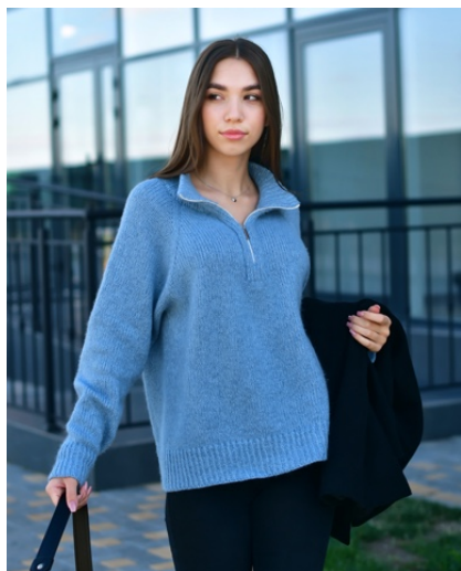
@puma_od (Разм L) Бобинная пряжа 1 нить - Toscano srl, art Puffo 80% меринос 18% па 100г/360м (расход 300гр) 2 нить - art. Basel 10% шелк 60% бамбук 30% лен 100г/500м (расход 225гр)