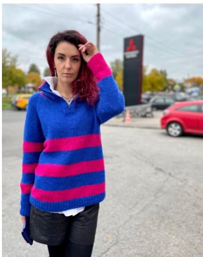
@darija_kir (Разм XS) Бобинная Munch 100г/260м 54% мохер 23% меринос 23% полиамид Расход 382гр (из них 100гр на полосы)