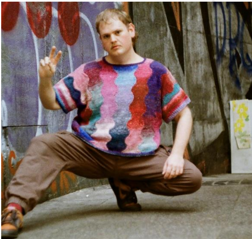
Схема со стр. 5 см

Для каждого 24-рядного повтора, который вы добавляете/вычитаете, вам также нужно будет добавить/вычесть 12 подхваченных петель в начале каждого сегмента.