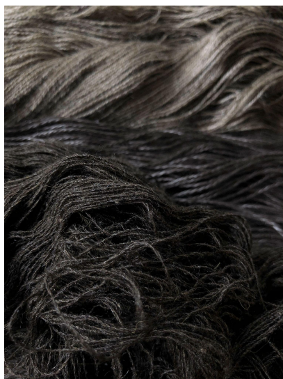
Цветоносный шелк (Y2)