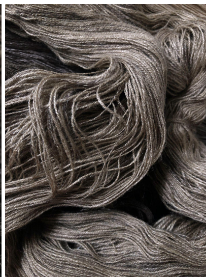
Туссарский шелк (Y3)