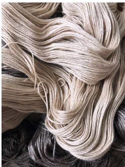
Шелковистый як (Y1)

Разработанный с большой легкостью, Дикие леса это хорошая многослойная вещь, которую можно носить с любой стороны как спереди поверх топов и платьев без рукавов, или с Гульсанг , майка в Shangdrok Silky Yak, названная в честь распространенных полевых цветов на Тибетском плато.