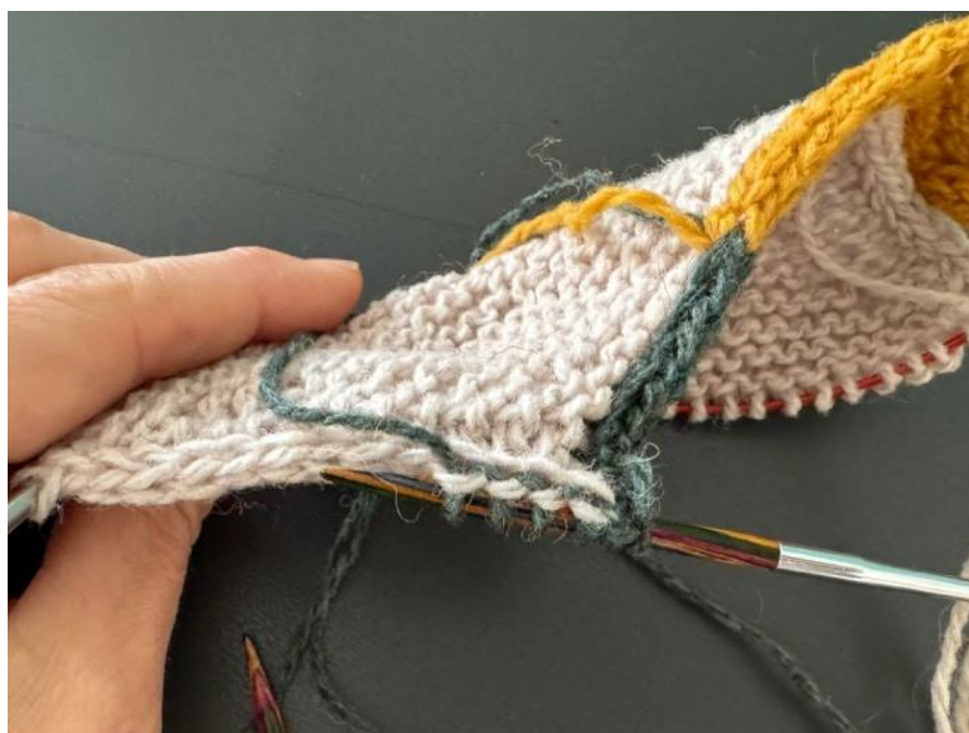
09: поднимите и провяжите лицевые петли вдоль края i-cord левого плеча (изнаночная сторона)

Затем провяжите 10 (10, 12, 6) (8, 4, 8, 8) рядов платочной вязкой с кромкой i-cord, закончив рядом с изнаночной стороны.