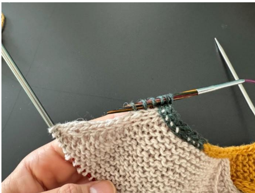
08: поднимите и провяжите лицевые петли вдоль края i-cord левого плеча (лицевая сторона)