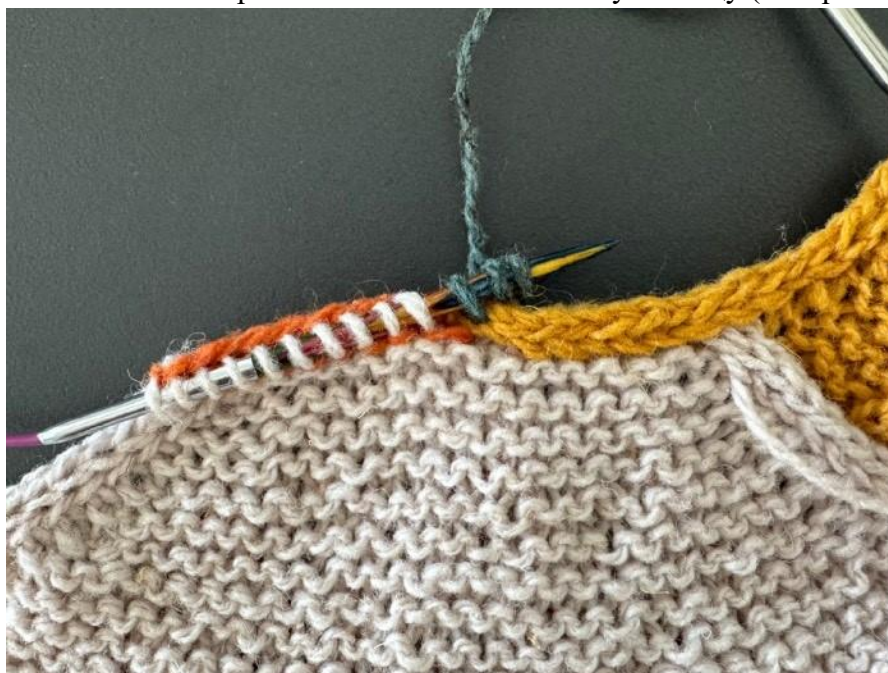
06: петли i-cord (лицевая сторона, все еще со вспомогательной нитью)

Затем, используя круговые спицы и находясь на лицевой стороне работы, поднимите и провяжите лицевыми три петли от основания кромки i-cord, которая проходит вдоль правой стороны горловины спинки. Переснимите эти петли на левую спицу (изображение 06).