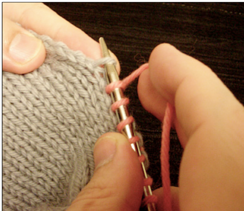
pick up and knit

Picking up sts this way ensured that the WS of the pick-up row looks almost like a normal row of purl bumps, instead of forming the small ridge that often forms on the WS of the work when picking up sts.