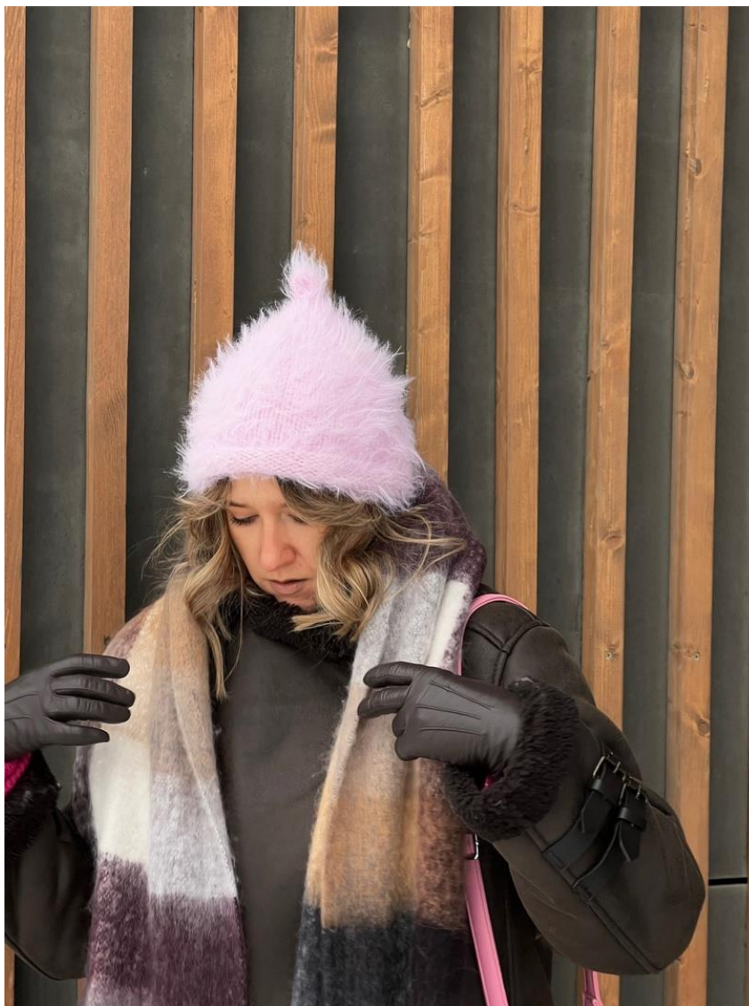
На фото шапочка из Lana Grossa Basta

Внимание! Все материалы, предоставленные в данном документе, являются собственностью Анастасии Ефремовой. Описание предназначено только для личного пользования. Запрещается копирование, распространение (в т.ч. некоммерческое), переработка, продажа или любое другое использование (как полного описания, так и его частей) без предварительного согласия правообладателя.