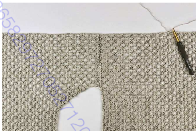
Рис. 7: Для правого рукава, присоединить новую нить к Ряду 17 (18 ) 19 (20 ) 21 (22 ) Спинки, считая от плечевого шва.