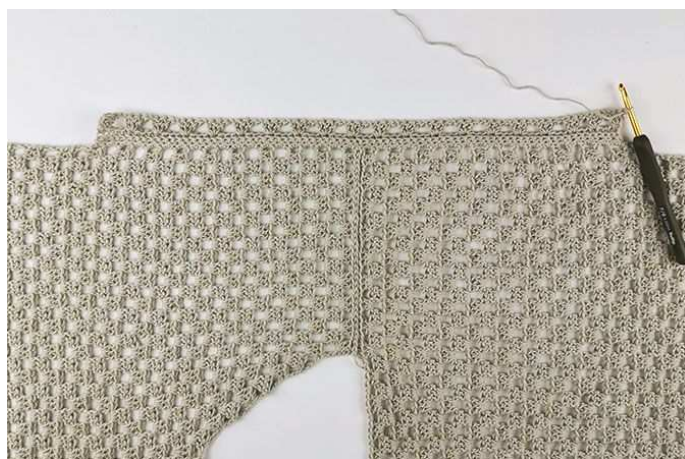
Рис. 8: Правый рукав после завершения Ряда 3.