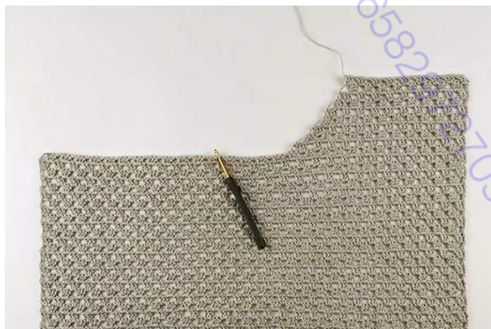
Рис. 1: Левая сторона переда (как при носке) закончена (показано в размере S).

Отрезать рабочую нить и протянуть ее через последнюю петлю, чтобы закрепить. Левая часть переда закончена ( рис.1 ).