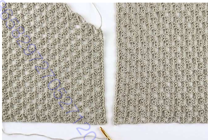
Рис. 5: Расположить петли плеча Переда параллельно петлям Спинки ..