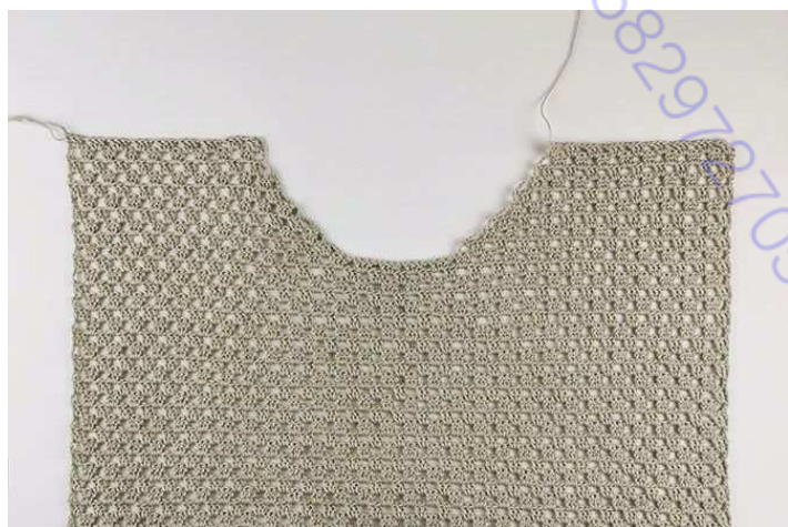
Рис. 3: Левая и правая стороны переда закончены.

Отрезать рабочую нить и протянуть ее через последнюю петлю, чтобы закрепить. Правая часть переда закончена ( рис.3 ).