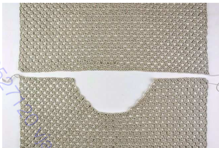
Рис. 4: Положите обе детали перед собой лицевыми сторонами вверх.