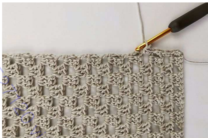
Рис. 10: Вязать по 2 сбн вокруг самого крайнего ссн.