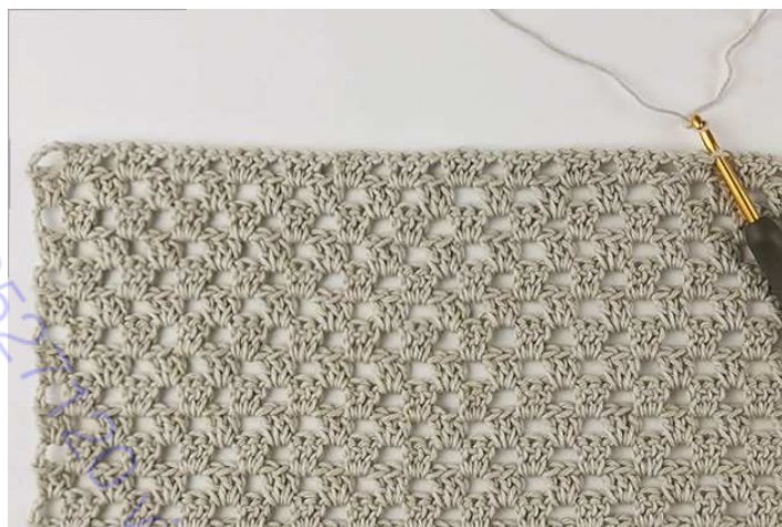
Рис. 2: Для правой стороны переда, присоединить новую нить к 11му (12му) 13му (14му) 15му (16му) 3-ссн-кластеру, считая слева (показано в размере S).

Для вязания правой стороны переда , положите всю переднюю часть перед собой лицевой стороной вверх, и присоедините рабочую нить к 11му (12му) 13му (14му) 15му (16му) 3-ссн-кластеру, считая слева ( рис. 1 и 2 ). Вязать след. образом: