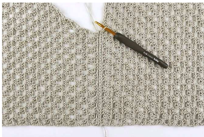
Рис. 6: ..и соединить оба слоя, используя соединительные столбики.