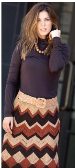
Схема вязания укороченными рядами