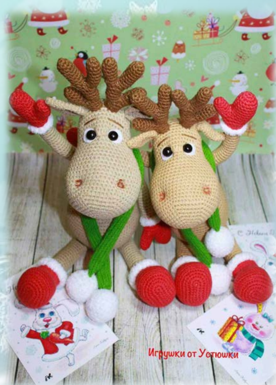
Игрушки от Устюшки