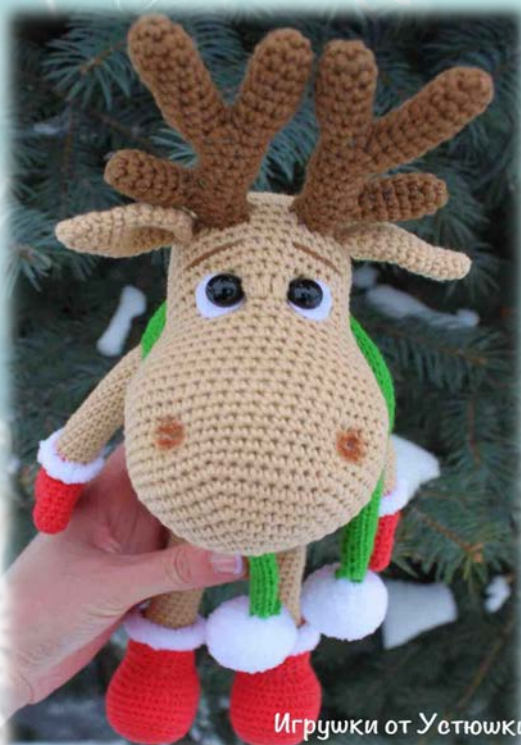
Игрушки от Устюшки