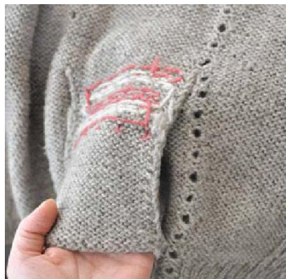
Карман с лицевой стороны