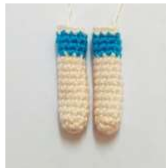
Фото 6 и 7.

Приклейте или пришейте повязку на голову.