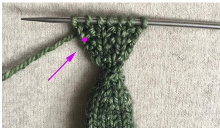
Ряд 7, Правая Ладонь