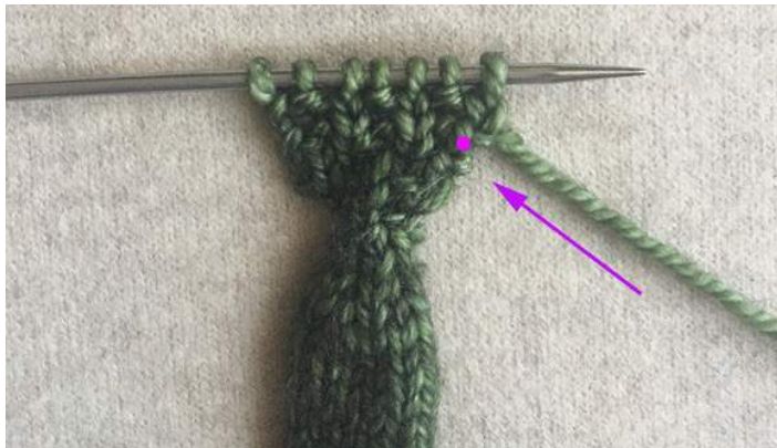
Ряд 7, Левая Ладонь