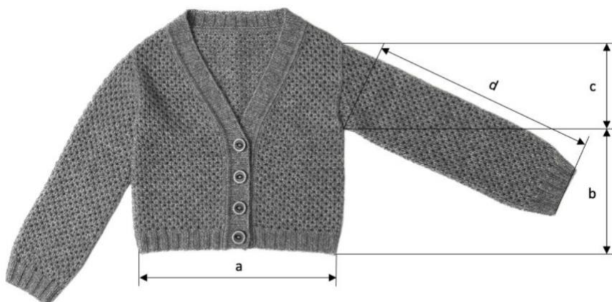
Таблица 1. Параметры готового изделия в соответствии с размерами