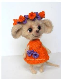
Мышка в веночке