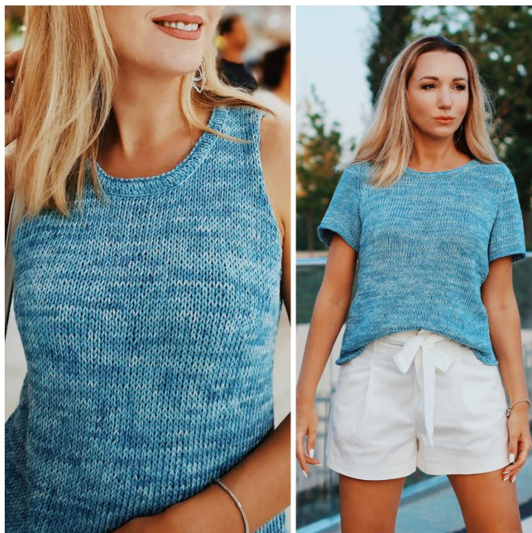
Таблица размеров женской одежды