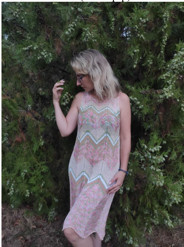
Платъе (44-46 р-р)