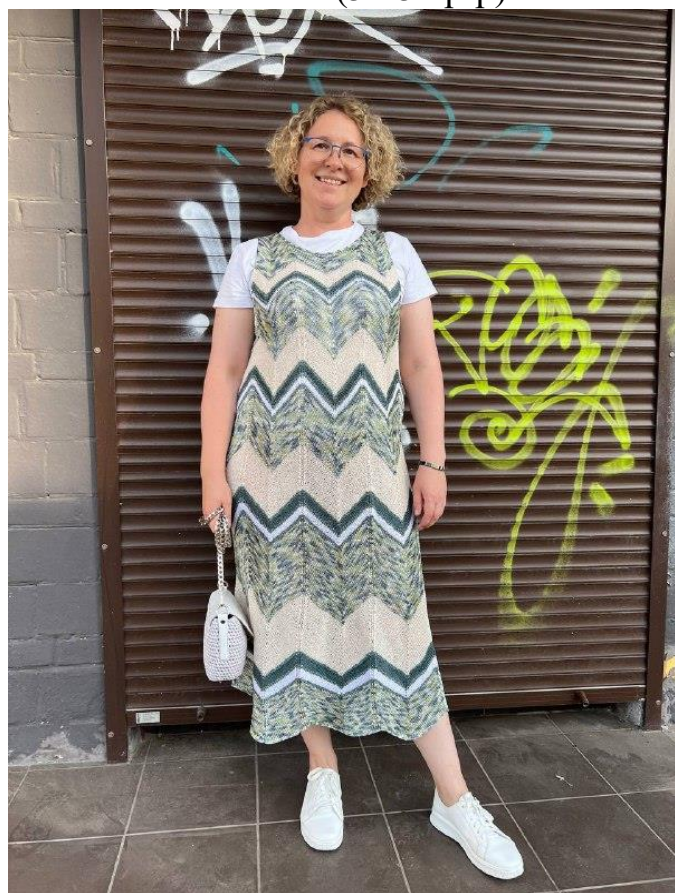
Платъе (52-54 р-р)