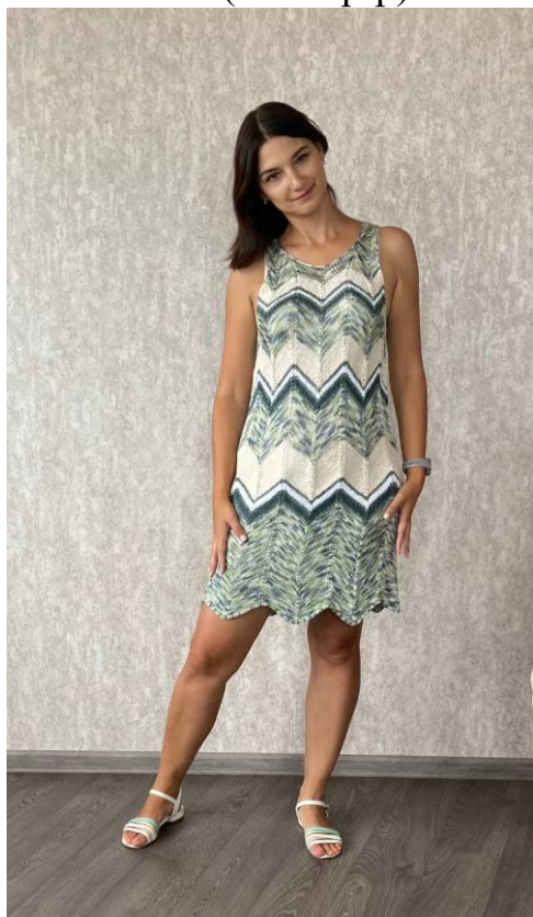
Платъе (40-42 р-р)