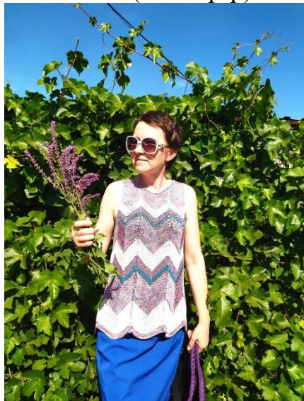
Майка (44-46 р-р)