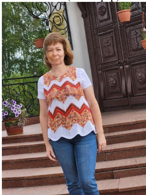
Майка (44-46 р-р)