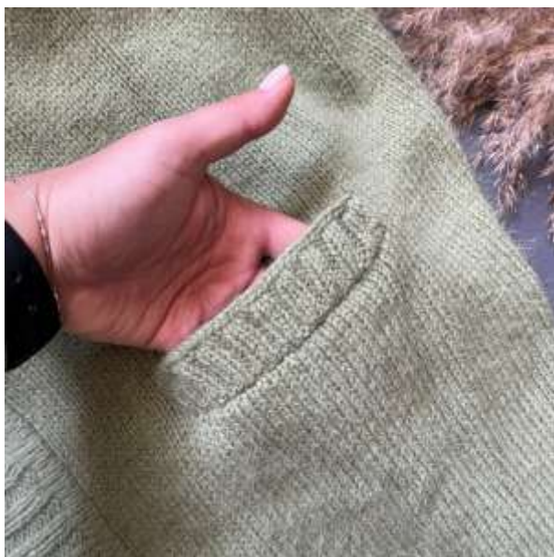
видео набора петель резинки кармана

*Если вы хотите карман сделать посвободнее, то в первом ряду резинки сделайте прибавки из протяжки предыдущего ряда.