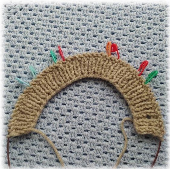
Фото приведено для примера.

Начиная с 8 ряда у нас появляется двойная кромочная (дв. кром). Формируется она ТОЛЬКО в конце каждого ряда.