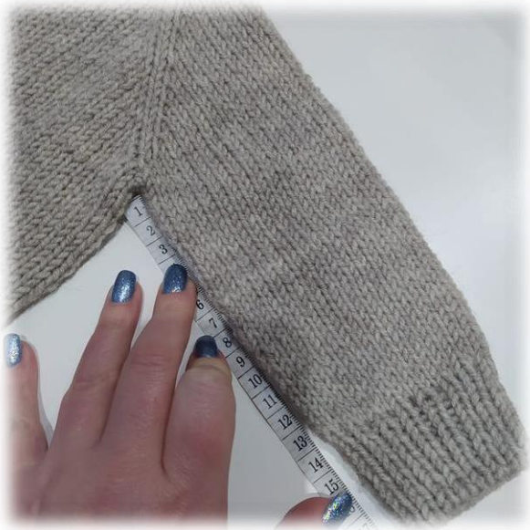
Фото приведено для примера.