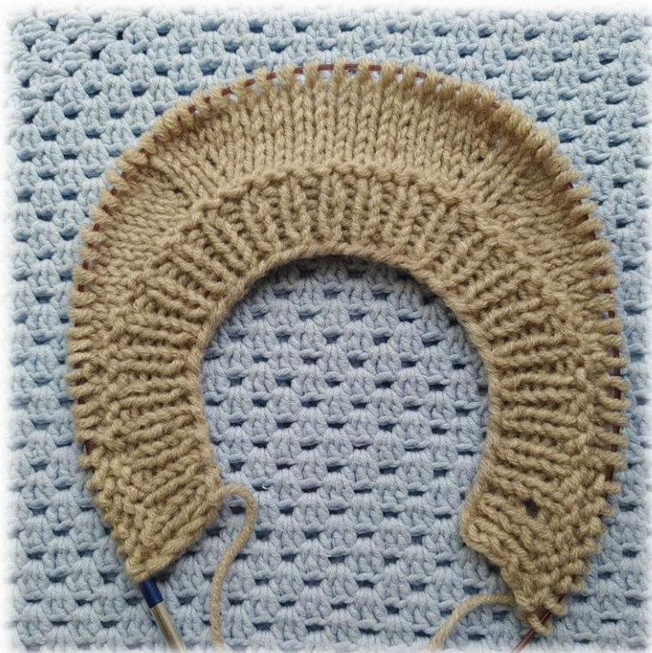
Фото приведено для примера.

На спицах у вас: 72/ 74/ 76/ 78/ 80/ 82/ 84 петель