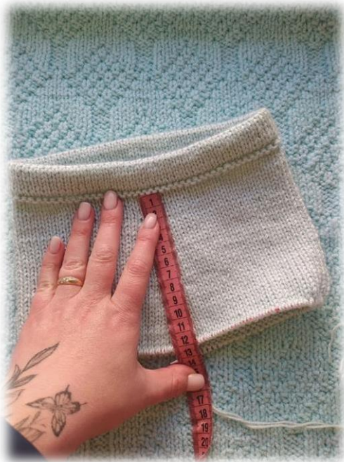
Фото приведено для примера