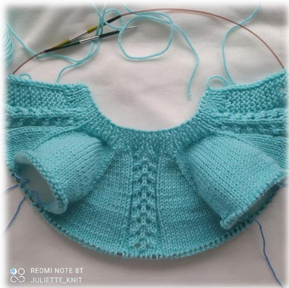
Фото приведено для примера.