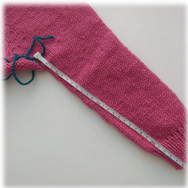
Фото приведено для примера.

Вторая штанина вяжется аналогично. Прикрепляя нить для вязания второй штанины, оставьте кончик нити длиной около 30 см, для сшивания ластовицы.