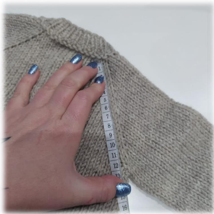
Фото приведено для примера.